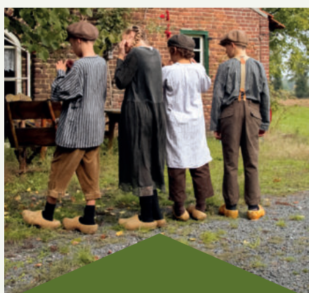
de jeugd van PUUR Theater