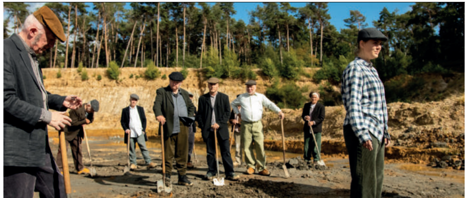
leden van het Reuvers Mannenkoor als kleisjtaekers