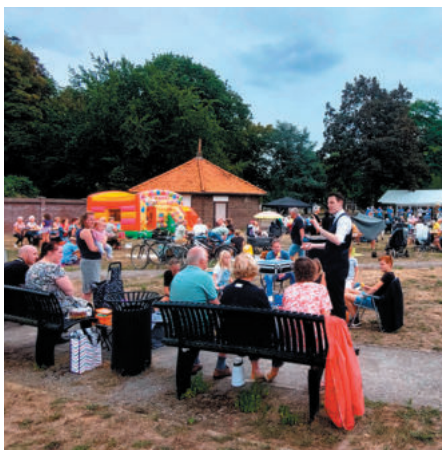
enkele sfeerimpressies van Picknicke bie de zusters

Al met al een prima eerste editie van dit dorpsfeest dat in 2023 zeker navolging zal hebben.