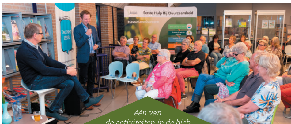
één van de activiteiten in de bieb