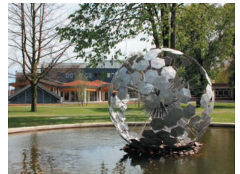
ons mooie Kloosterpark als decor voor Picknicke bie de Zusters

Wie niet wil meedoen aan de activiteit maar wel graag wil meehelpen als vrijwilliger: schroom niet en mail naar info@kernoverleg.nl