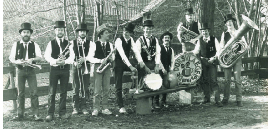
De Dorsvlaegels in de beginjaren

Een ander kenmerk is dat de kepel alleen uit mannen bestaat. Hoewel de reden 'vrouwe kriege kinjer en den kèns se neet altied op häör raekene' niet meer van toepassing is, zijn ze nu al 44 jaar vrouwloos en dit zal ook zo blijven. Verder is