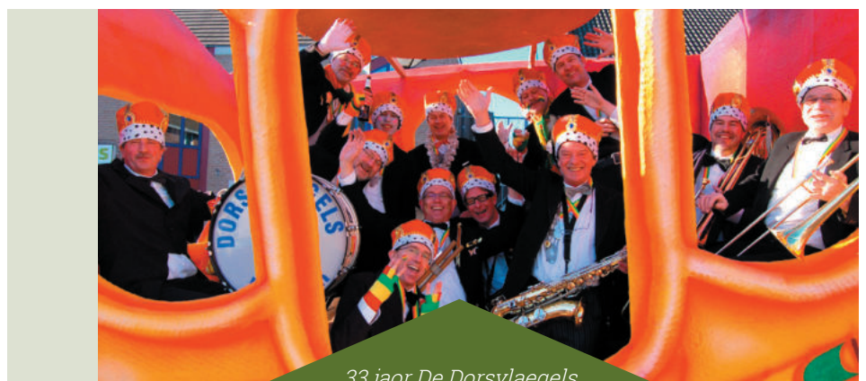
33 jaor De Dorsvlaegels

Ze repeteerden op verschillende plekken: Het Rode Kruisgebouw aan de Keulseweg, de Harmoniezaal, De Haam en Ronckenstein. Nu repeteren ze in de Paerssjtal waar ze op zaterdag 14 mei dan ook hun 44-jarig bestaan vieren. Ondanks het feit dat ze niet verjongen, hopen wij dat we ze over 11 jaar wederom mogen feliciteren. De Dorsvlaegels houden hun receptie van 19.00 uur tot 20.30 uur en hopen jullie in grote getalen te mogen begroeten.