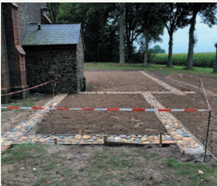
'Het opgaand muurwerk van het oude kerkje is in het terrein met maaskeien aangegeven'

Het oorspronkelijk kerkje bestond uit een éénbeukig schip waarvan het koor ongeveer ter hoogte lag van de huidige kapel. Tijdens de Nationale Archeologiedagen van 18 t/m 20 juni 2021, werd door de werkgroep archeologie van de heemkundevereniging Maas- en Swalmdal de bovenkant van de fundamente, bestaande uit in kalkmortel gelegde maaskeien, vrij gelegd. Het kerkje had een afmeting van 7.70x13 m. Het fundament van het hierop aansluitend koor bedroeg 5.35x7.10 m. Inmiddels heeft een werkploeg van