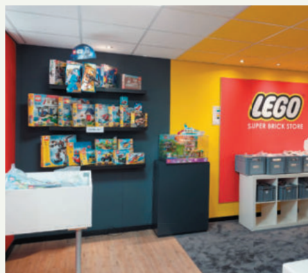
binnenkijken bij Super Brick Store

Twan koopt partijen gebruikte LEGO in, controleert of alles compleet is en dan worden de sets gewassen. Ontbrekende stukjes worden aangevuld. Een instructieboekje hoort er natuurlijk bij en soms ook nog een originele doos. Het meeste zit in plastic zakken verpakt.