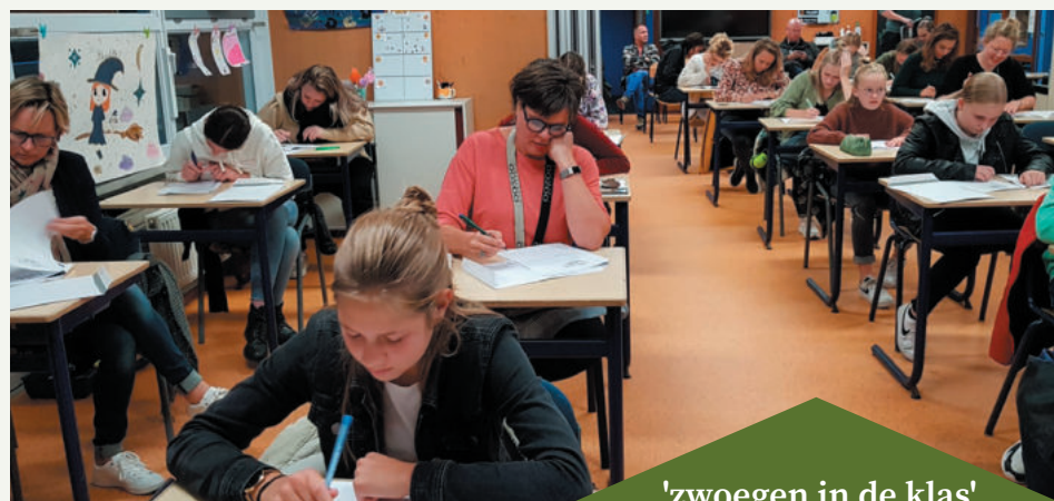
'zwoegen in de klas'

Vrijdag 26 November zal de prijsuitreikingsavond plaatsvinden, waar iedereen nog eens terug kan kijken naar een zeer geslaagde editie van Ruiverpedia.