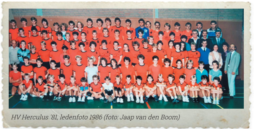
HV Hercules '81, ledenfoto 1986

Uiteraard zullen er voor de jeugd nog enkele digitale challenges verzonden worden waarmee het, als de omstandigheden het toelaten, toch nog een spetterend jubileumjaar wordt voor de jubilerende vereniging.