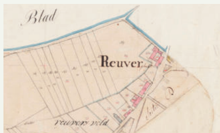
1781 (detail van een kaart van landmeter Smabers, GHS Beesel)

Meer weten over onze historie: www.loegiesen.nl