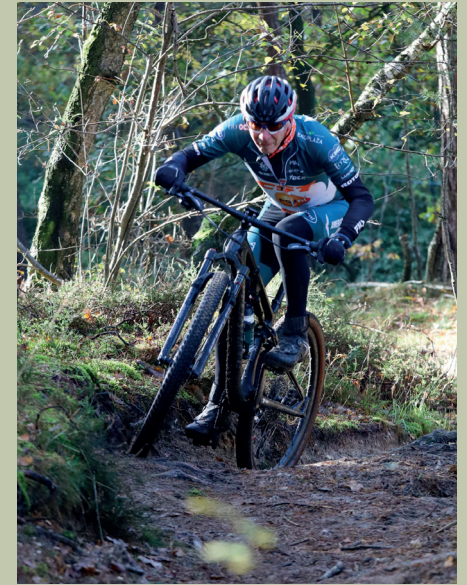
afbeelding T.W.C. De Paerssijal 2023

Actuele informatie vind je op www.facebook.com/twc.reuver/