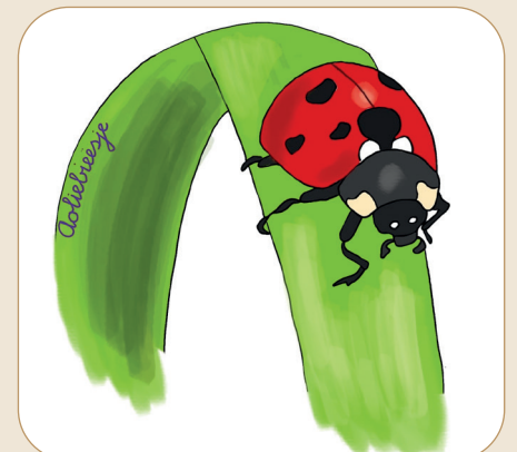
Tekening Gijs Huijbers 2024