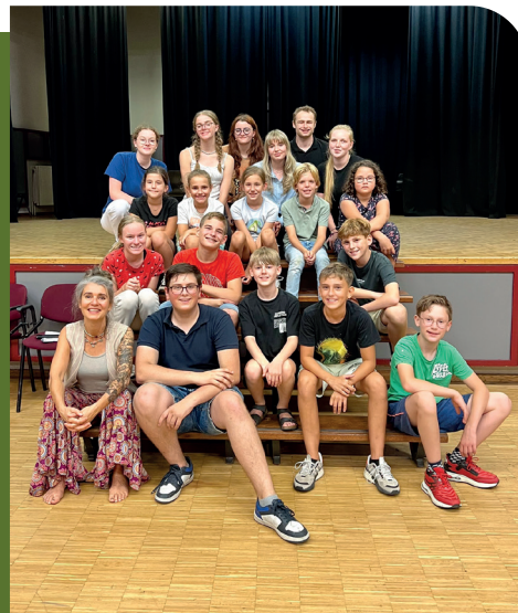
de jeugdgroep met regisseuse van Toneelgroep Reuver

Luxor begint als feestzaal in 1903 naast toenmalig café Buitenlust. In 1932 wordt de zaal omgebouwd tot bioscoop Luxor. De stoelen staan los opgesteld zodat het toch nog als feestzaal is te gebruiken. Tot 1982 vinden in deze zaal vele dorpsactiviteiten plaats maar met de komst van de Schakel en het Centrum valt die functie grotendeels weg. Daarom neemt toenmalig eigenaar Jo Paquay het besluit te stoppen met deze functie en de zaal definitief tot de 1e servicebioscoop in Nederland om te bouwen.