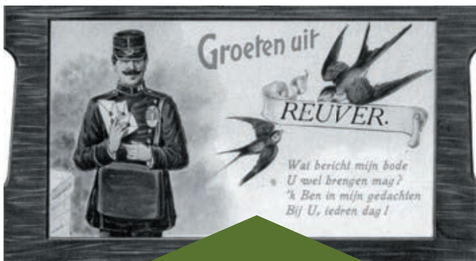
oude ansichtkaart met 'groeten uit de vorige eeuw'