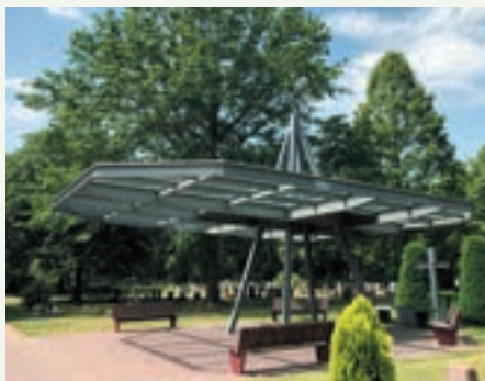
twee van de gerealiseerde projecten door Kernoverleg Reuver; speeltoestellen in Schinderspark en de overkapping bij het kerkhof