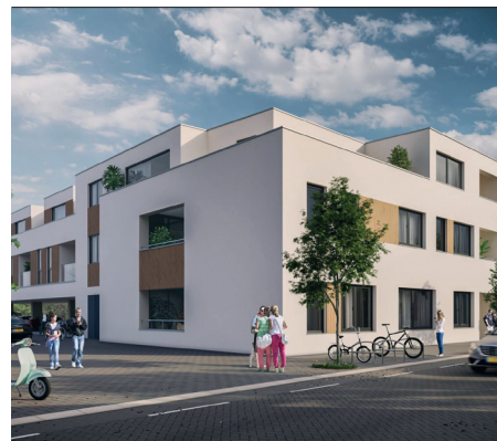
Artist's impression van het appartementencomplex aan de Rijksweg in Reuver

Drie maanden geleden is de voormalige apotheek aan de Rijksweg eindelijk gesloopt om plaats te gaan maken voor twaalf appartementen. Een deel van die toch wel lelijke façade -de entree van ons centrumgaat vervangen worden door een nieuw, modern gebouw.