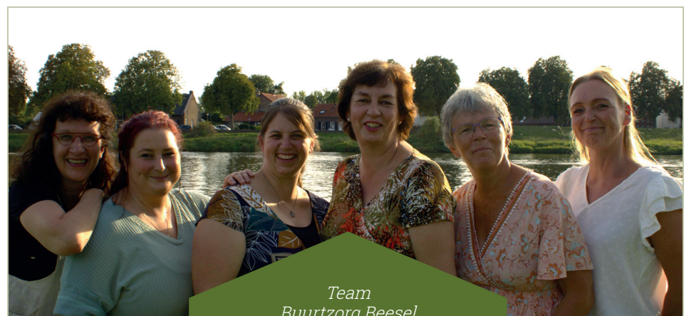
Team Buurtzorg Beesel