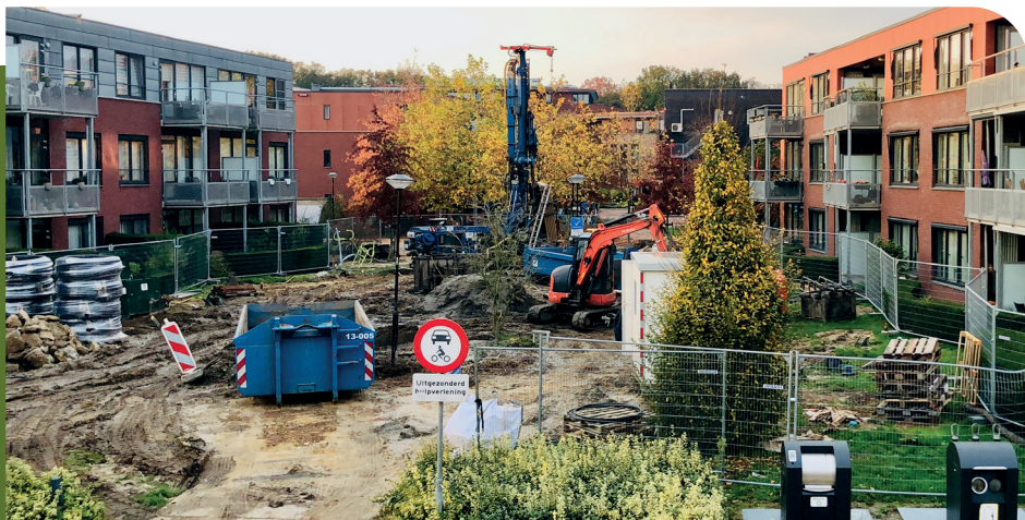
werkzaamheden Bösdael eind oktober 2024

U heeft het vast al gezien (of gehoord). Tussen de gebouwen in Bösdael wordt al een hele tijd geboord. Maar waarom? Zit er olie, gas of kolen? Nee, niets van dat alles. Het gaat om aardwarmte, een duurzame energiebron. Hoe dieper je gaat, hoe warmer het water wordt. “In totaal worden er maar liefst 46 gaten van 150 meter diep geboord. De diameter is 152 millimeter” licht David van Bergen van de ReDo-groep toe. “In die gaten worden PE-leidingen met een diameter van 40 millimeter geplaatst. Deze worden als lussen gemonteerd in het geboorde gat zodat er water kan circuleren. Het is een gesloten systeem en komt dus niet in aanraking met het drinkwater. Het water dat naar boven wordt gehaald heeft een temperatuur van ongeveer 12 - 14 graden. Dit water