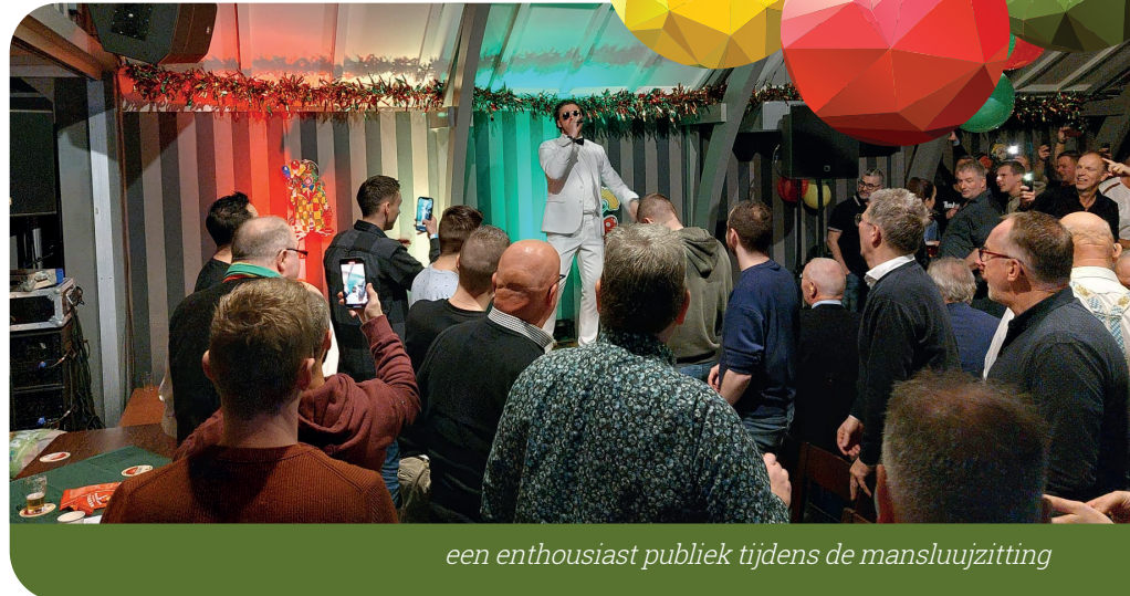
een enthousiast publiek tijdens de mansluujzitting

Bij navraag aan de organisatie bleek dat er door de jaren heen wel wat verschillen zijn opgevallen tussen de Vrouwluuj en Mansluuj. Als